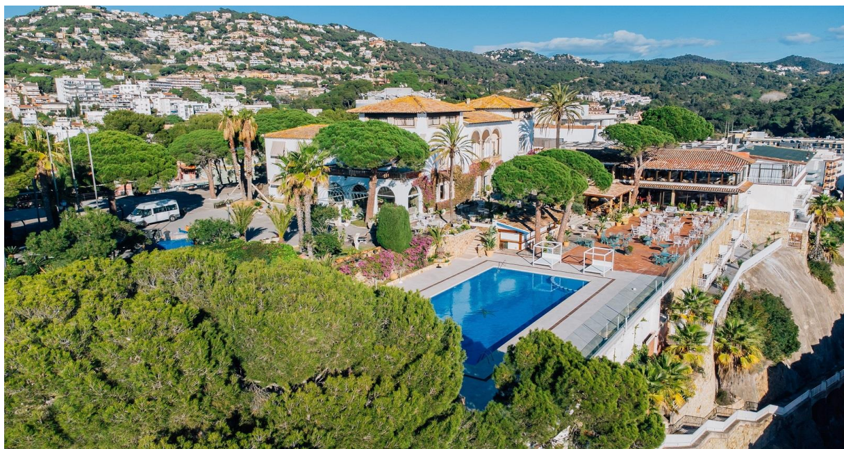
Hotel Roger de Flor i Lloret de Mar

Välkomna till vårt nya golfresmål på Costa Brava-kusten norr om Barcelona! Följ med oss till semesterorten Lloret de Mar där det fortfarande är sommarlika temperaturer i oktober. I området finns ett antal mycket bra golfbanor och på vår resa spelar vi på fyra av dessa: Torremirona Golf , Golf Costa Brava (2 dagar), Golf de Pals och Golf d'Aro Mas Nou . Alla med busstransfer mellan 30 – 60 minuter varje morgon.