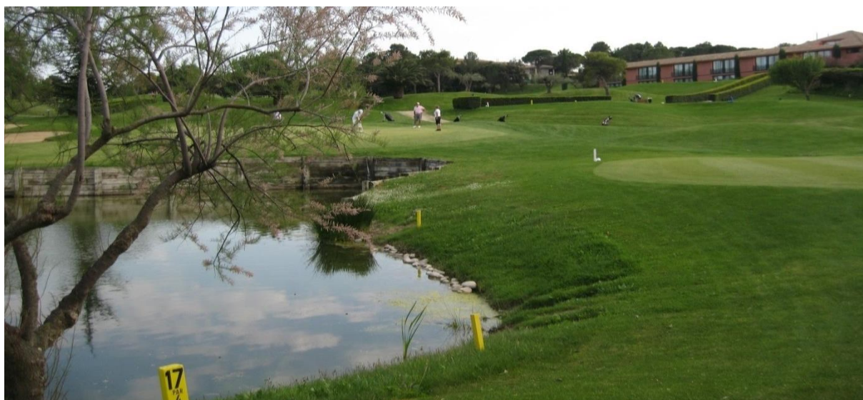
Torremirona Golf, en av Costa Bravas mest uppskattade golfbanor