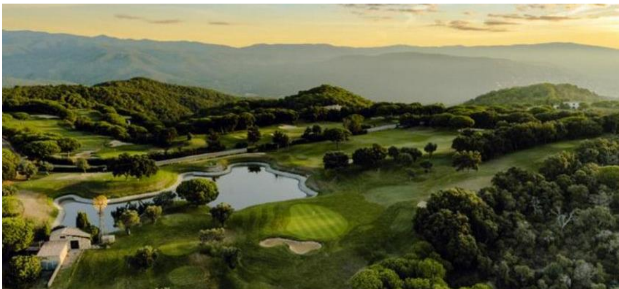
Golf d'Aro Mas Nou