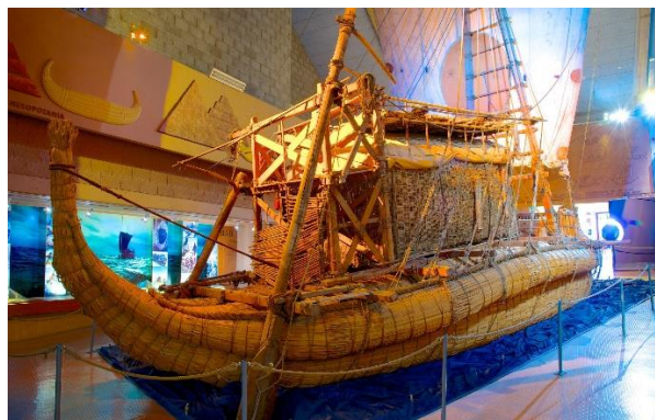
Flottar från Thor Heyerdahls upptäcktsfärder

kollen som ligger en mil utanför Oslo, ett känt skidcenter vintertid. Här kan man ta sig upp i hopptornet för magnifik utsikt eller bara promenera vid skidcentret där Anders Södergren en gång välkomnades av 50 000 norrmän när han vann femmila 2006 och 2008. Den gamla hoppbacken är numera ersatt av en ny och större hoppbacke, som togs i bruk till Skid-VM i Oslo 2011. Efter detta besök med fantastisk utsikt över staden, tar vi fatt på hemresan mot Göteborg. Vi kör E6:an hela vägen, över den nya Svinesundsbron och till Rasta Håby. Här serveras resans sista middag på Rasta och vi beräknar att komma tillbaka till Göteborg runt kl. 20.30, och därefter till Frölunda en kvart senare.