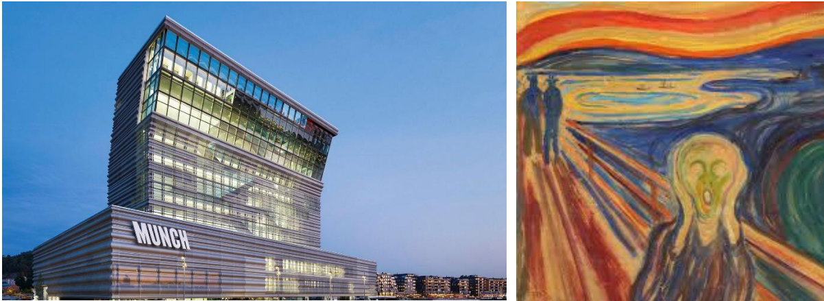
Munch Konstmuseum med den berömda målningen "Skriet"

böcker. Efter detta intressanta besök fortsätter vi till Bygdøy och Kon-Tiki-Museet. Det är ett museum över Kon-Tiki-expeditionen (1947) och över andra expeditioner som leddes av Thor Heyerdahl: Ra I (1969), Ra II (1970) och Tigris (1977). Museet innehåller också föremål som Thor Heyerdahl samlat vid sina arkeologiska utgrävningar på Påskön, en kopia av en av öns basaltstatyer och en kopia av en relief av mytiska fågelmän, som Heyerdahls grupp fann vid utgrävningar i Tucume i nordvästra Peru. Här finns även en kafeteria för en lättare lunch eller fika. Vi fortsätter till Holmen-