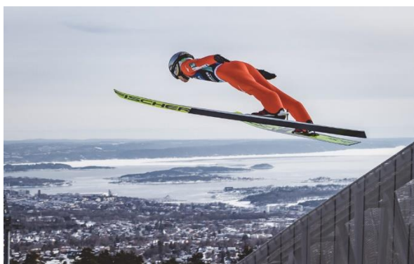
Holmenkollen utanför Oslo