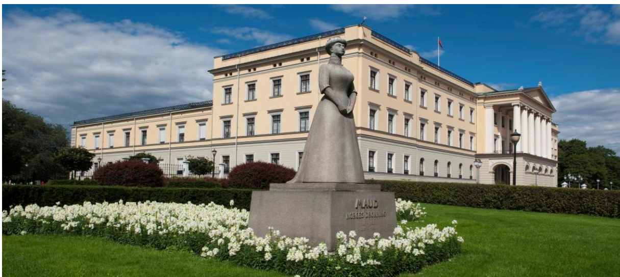
Vårt hotell ligger nära det kungliga slottet i Oslo

Kapplandsgatan 10, 414 78 Göteborg Tel 031 41 12 00 www.komfortresor.se mejl: anders@komfortresor.se 13 år med resor från Göteborg