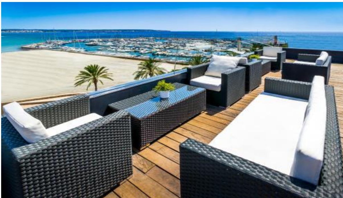
Hotellets takterrass, även med loungebar