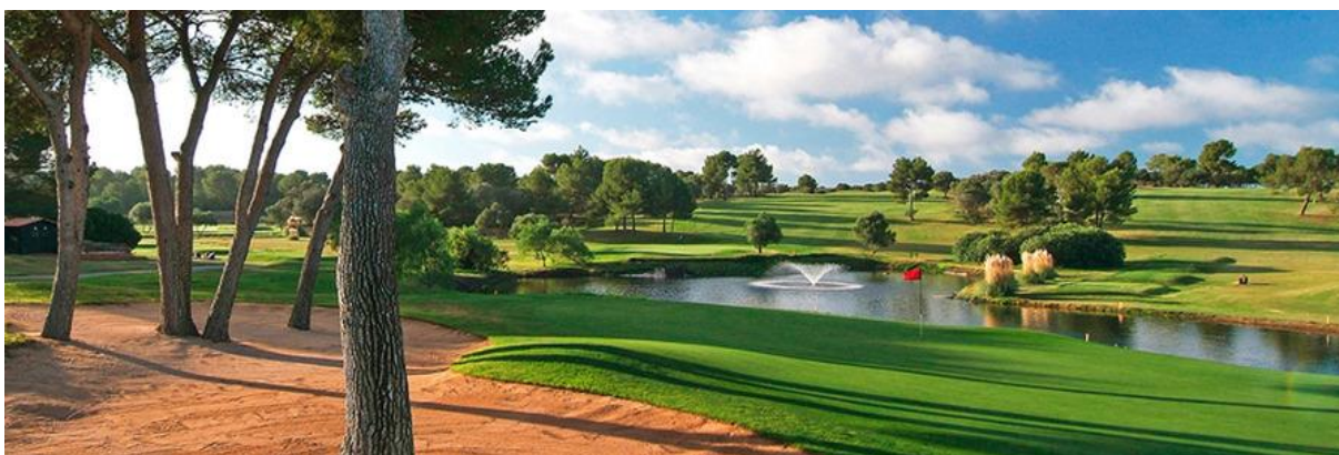
Golf Maioris