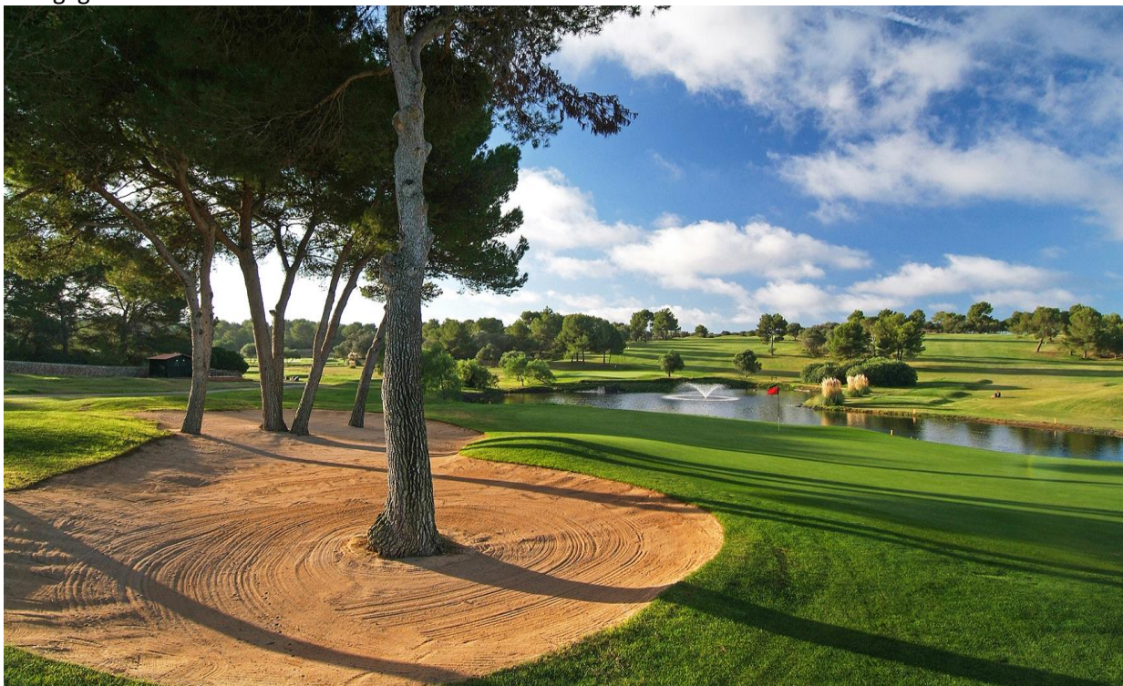
Golf Maioris (Foto: Golf) Maioris)

Resans sista dag börjar med frukost på hotellet. Kl. 13.00 packar vi in bagaget i vår transferbuss för färd tillbaka till Palmas flygplats. Då Norwegian har slutat flyga till Göteborg på torsdagar, kommer vi i stället att åka till Oslo-Gardermoen. Flyget avgår till Oslo kl. 15.40 och vi landar på Gardermoen kl. 19.15. På Gardermoen väntar Leja Tourings förstklassiga buss på oss för busstransport tillbaka till Göteborg. På Rasta Håby serveras en enklare kvällsmåltid som plåster på såret för en lång och krånglig hemresa.