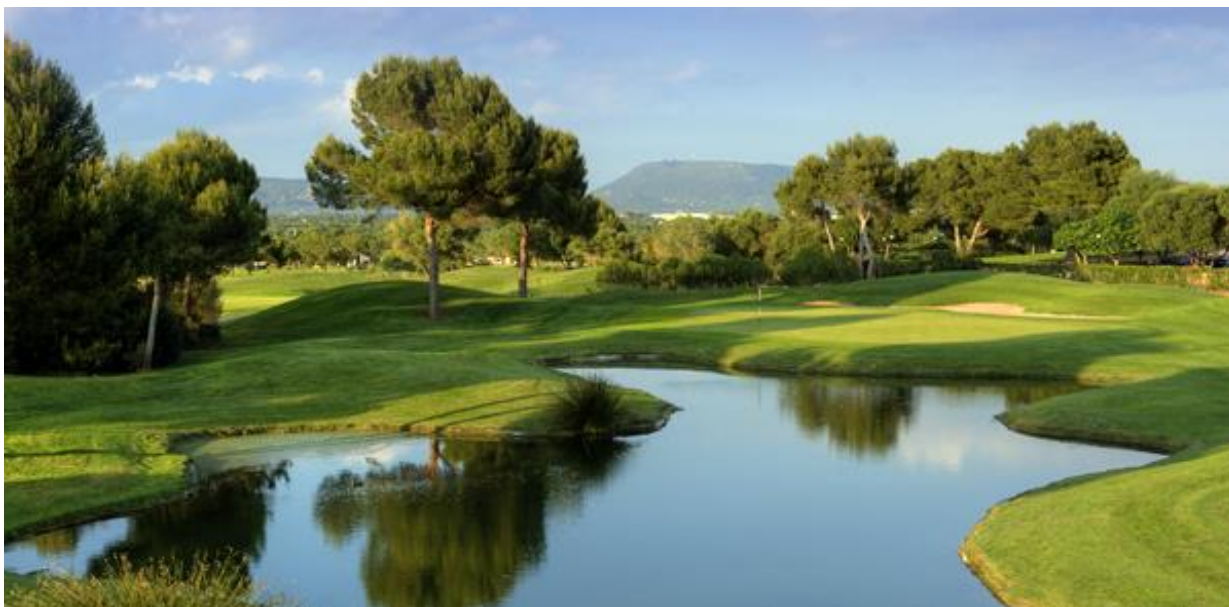
Golf Son Antem