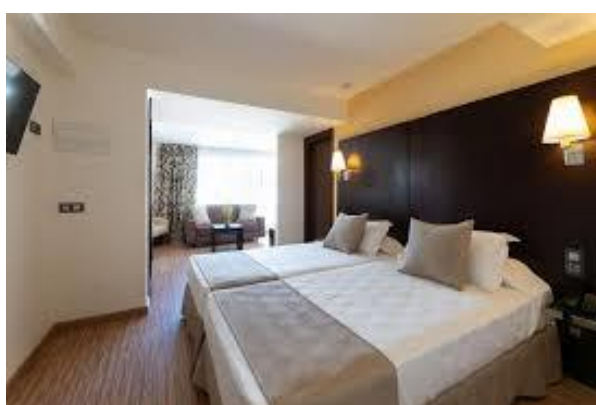
Vårt 4**** Nautic Hotel & Spa i Can Pastilla