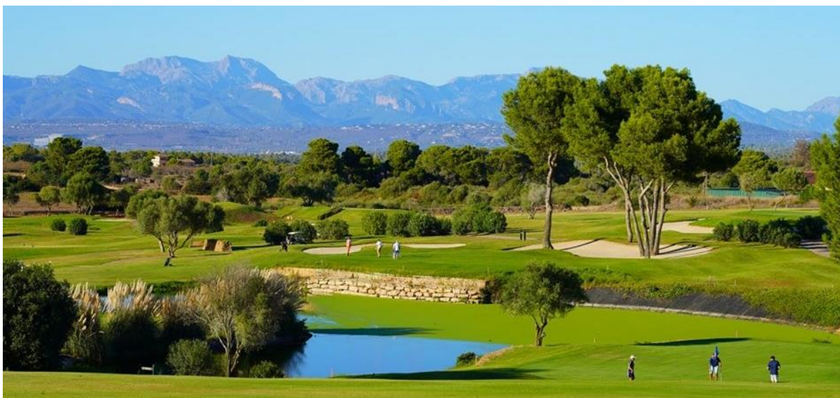
Golf Maioris

Komfort Resor har ställt lagstadgad resegaranti enligt Kammarkollegiets regler.