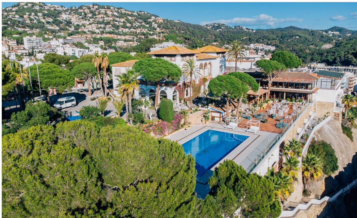
Hotel Roger de Flor i Lloret de Mar

Välkomna till vårt nya golfresmål på Costa Brava-kusten norr om Barcelona! Följ med oss till semesterorten Lloret de Mar där det fortfarande är sommarlika temperaturer i oktober. I området finns ett antal mycket bra golfbanor och på vår resa spelar vi på två av dessa: Torremirona Golf (två dagar) och Golf Costa Brava (grön och röd slinga) (tre dagar). Alla med busstransfer mellan 30 – 60 minuter varje morgon.