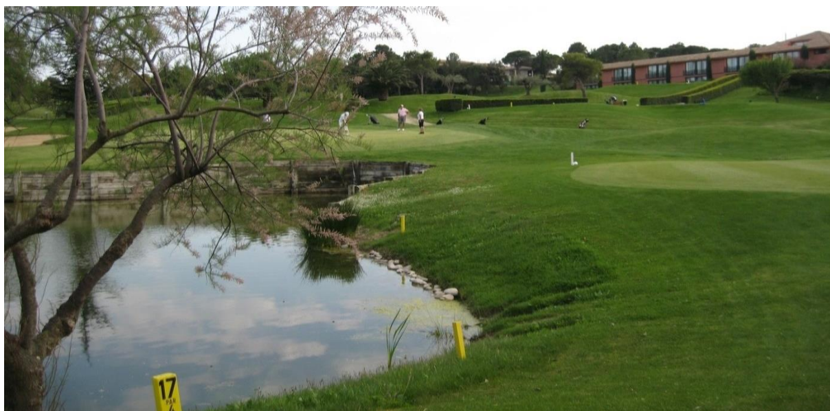
Torremirona Golf, en av Costa Bravas mest uppskattade golfbanor