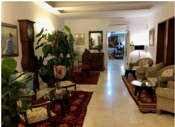
Många trevliga sittgrupper på hotellet