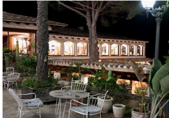
Terrassen om kvällen