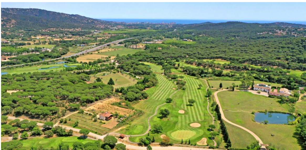
Club de Golf Costa Brava