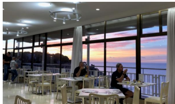
Frukostsalen vid soluppgång