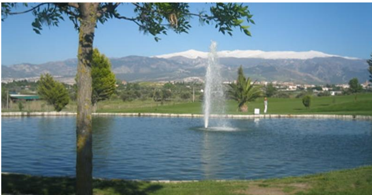
Granada Club de Golf ligger vid foten av bergskedjan Sierra Nevada