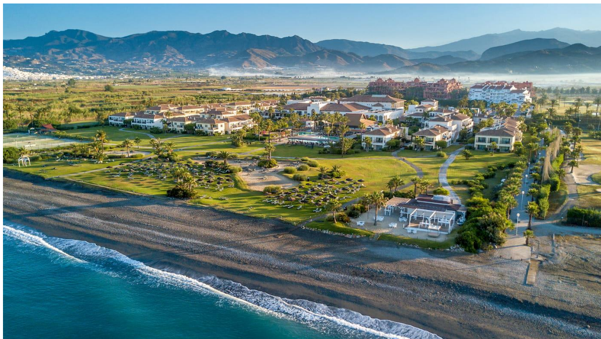
Impressive Resort Playa Granada ligger vid Los Moriscos Golfbana

Välkomna till vårt härliga golfresmål på Costa Tropical! Följ med oss till Andalusien och till den del av Spanien som har vinterns mildaste klimat. Här spelar man golf året om, och det är sommarlika temperaturer redan i april! Vi bor vid golfbanan Los Moriscos Golf på fina Impressive Resort Playa Granada . Hotellet erbjuder 4-stjärnig klass och 1:a tee på Los Moriscos Golf ligger bara ett par minuters transfer från hotellet (800 m)! Vi spelar två dagar på Los Moriscos Golf , en dag på Baviera Golf (nyhet) och två dagar på Granada Club de Golf (som ligger nära den historiska staden Granada vid foten av bergskedjan Sierra Nevada).