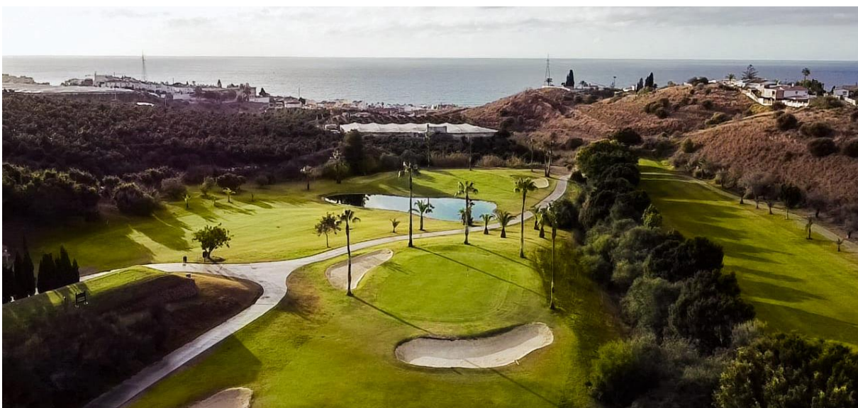
Baviera Golf