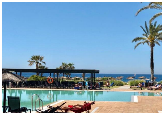
Vårt hotell