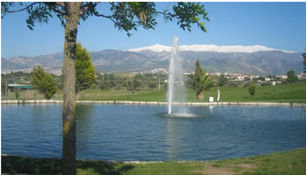
Granada Club de Golf ligger vid foten av bergskedjan Sierra Nevada