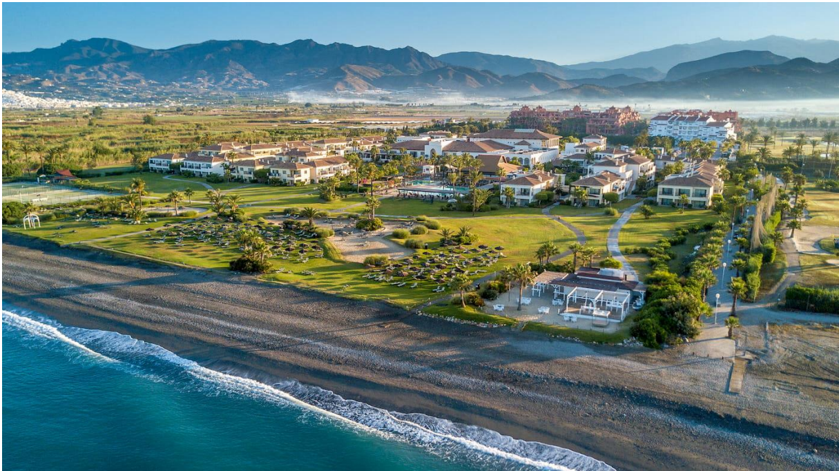
Impressive Resort Playa Granada ligger vid Los Moriscos Golfbana

Välkomna till vårt härliga golfresmål på Costa Tropical! Följ med oss till Andalusien och till den del av Spanien som har vinterns mildaste klimat. Här spelar man golf året om, och det är sommarlika temperaturer även i november! Vi bor vid golfbanan Los Moriscos Golf på fina Impressive Resort Playa Granada . Hotellet erbjuder 4-stjärnig klass och 1:a tee på Los Moriscos Golf ligger bara ett par minuters transfer från hotellet (800 m)! Vi spelar tre dagar på Los Moriscos Golf och två dagar på Granada Club de Golf (som ligger nära den historiska staden Granada vid foten av bergskedjan Sierra Nevada).