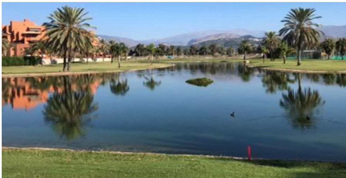
Los Moriscos Golf