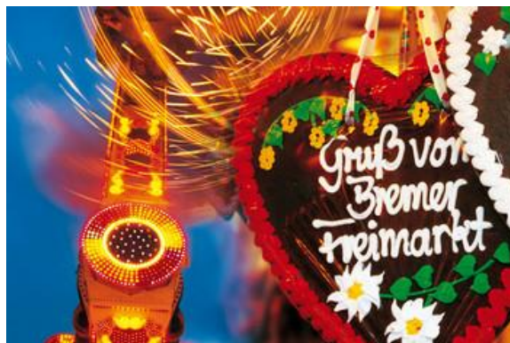
Bremer Freimarkt – Burgerweide – ligger nära hotellet mitt i centrala Bremen