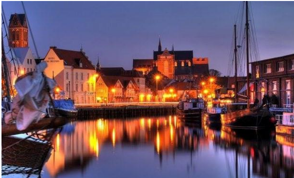
Hotel New Orleans ligger centralt vid hamnen

Vi samlas vid Posthotellet på Drottningtorget kl. 07.30 där vår förstklassiga buss väntar. Möjlighet att stiga på bussen även vid Frölunda Torg, gaveln vid resecentrum kl. 07.50 och vid OK-Q8-macken vid IKEA-avfarten Källered kl. 08.15. Första etapp går till Hallandsåsen där det serveras kaffe och fralla. Sedan fortsätter vi söderut mot Malmö och tar Öresundsbron över till Danmark. Vi passerar Kastrup och fortsätter till Rödby där färjan avgår till Puttgarden i Tyskland kl. 14.45. Färjan tar 45 minuter och vi får tid att såväl äta lunch på egen hand samt shoppa lite i butikerna ombord. I Puttgarden kör vi av färjan och åker direkt ut på de tyska motorvägarna österut mot Wismar. Vid 18.00-tiden checkar vi in på fina Hotel New Orleans i centrum nära hamnen med promenadavstånd till julmarknaden och alla varuhus. Kl. 19.30 serveras gemensam middag i hotellets trevliga restaurang.