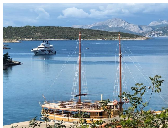
Makarska Rivieran

Vi välkomnar alla på höstens resa som denna gång går med flyg till Split i Kroatien och det vackra området Makarska Rivieran söder om Split. Oktober månad är en perfekt månad att åka till Kroatien – inte för varmt men man kan känna att sommarens värme fortfarande påverkar havet och bjuder på salta varma bad. Under vår vistelse kommer vi att bo i Brela, en av många trevliga turistorter längs den vackra kroatiska kusten och ett fint utgångsläge för intressanta utflykter.