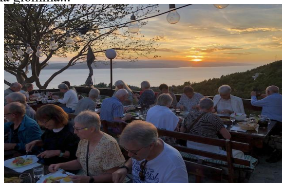
Kroatisk afton med sång och underhållning, vid fint väder utomhus!