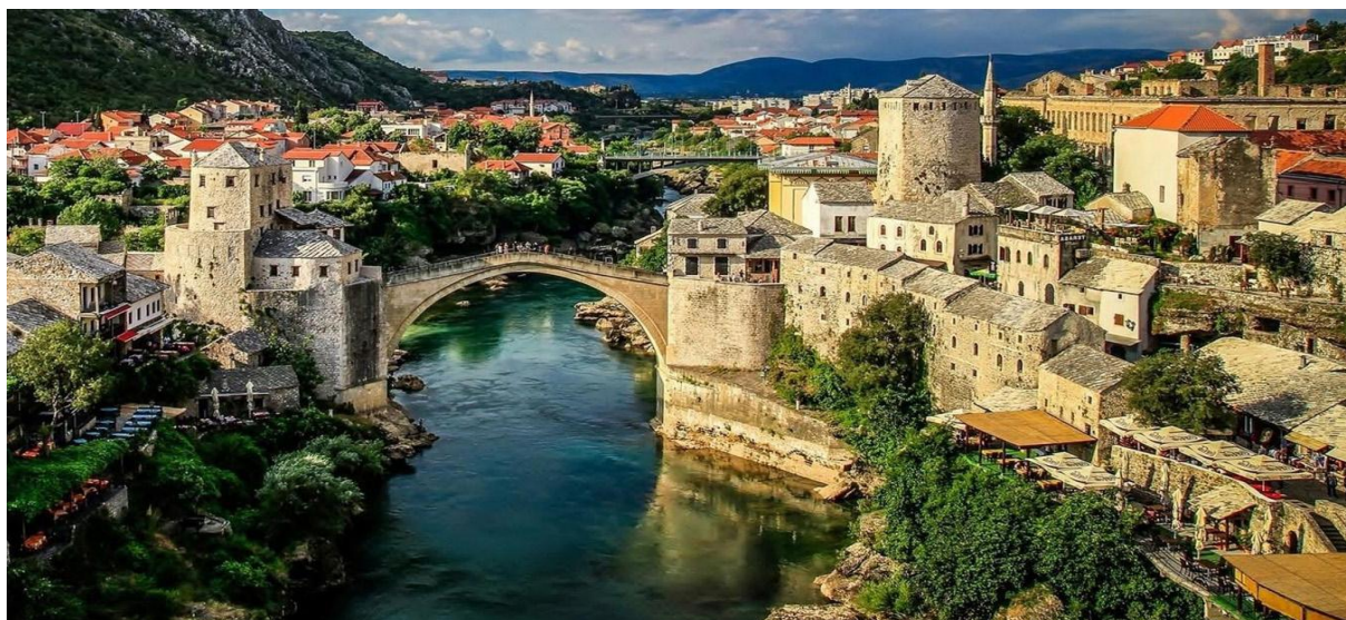
Mostar - Stari Most

Efter frukost tar Agneta med oss på en spännande utflykt till grannlandet Bosnien-Hercegovina. Här finns många vackra byar, men Mostar är kanske den vackraste, i alla fall den mest kända. Stadens arkitektur är en blandning mellan gammal och ny osmansk arkitektur men med inslag av österrikisk stil. I staden ser vi den gamla bron Stari Most, som förstördes i kriget på 1990-talet, men som blev återuppbyggd igen 2004. Mostar var tidigare en av de viktigaste handelsstäderna i regionen tack vare sitt läge vid floden Neretva. Här levde invånarna i fred fram till att krigets tragedier förändrade staden för alltid. Idag är staden splittrad med katoliker på västra sidan av Neretva och muslimer på östra sidan. I Mostar ser man fortfarande tydliga spår från kriget, kanske mer än på någon annan plats i det forna Jugoslavien. Lunch ingår på en trevlig restaurang innan vi så småningom sätter kursen tillbaka mot Kroatien och Baska Voda. Efter en lång dag smakar nog middagen extra gott ikväll.