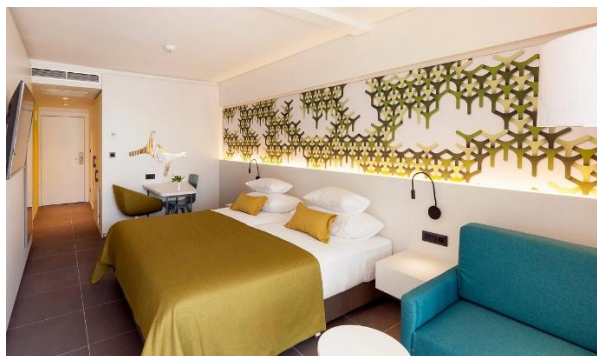
Vårt fina hotell Berulia

OBS: För allas trevnad försök vara så doftfria som möjligt. Tänk på våra allergiker.