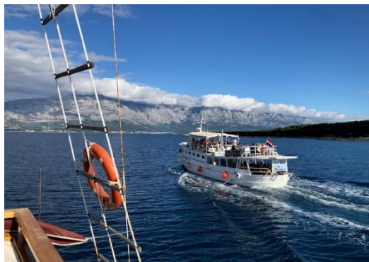
Båttur på havet

Efter frukost promenerar vi till vår båt som väntar på oss för en härlig dag på havet. Utanför Baska Voda finner vi de vackra öarna Hvar och Brac. Vi kommer att gå i land i Sumartin och Povlja, där vi besöker den vackra kyrkan och även ett intressant museum. Vi lägger också till i en fin vik där lunch serveras ombord på båten. Om vädret är bra kan vi ta ett dopp i havet! Vi är tillbaka på hotellet under eftermiddagen för lite vila innan middagen.