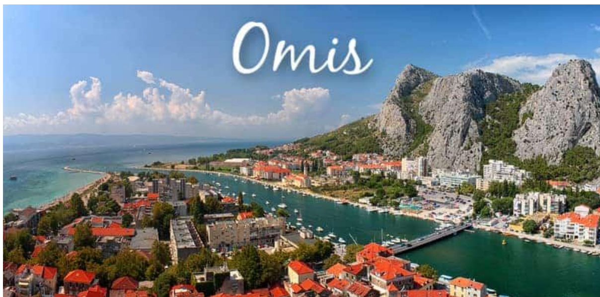
Floden Cetina och staden Omiš

Idag blir det en intressant utflykt i vårt närområde. Först reser vi till staden Zadvarje och får uppleva den lokala marknaden som är en över 300 år gammal tradition. På marknaden varje tisdag kan man köpa det mesta som behövs för livet på landsbygden och andra delikatesser som hemmagjord snaps, honung och lufttorkad skinka. Efter marknadsbesöket fortsätter vi till staden Omiš där floden Cetina rinner ut i Adriatiska havet. Som många andra städer längs kusten har även Omiš en lång historia, bland annat den delen som tillhörde piraterna på 1200- och 1300-talet. Idag är det en fredlig stad med sin fina sandstrand och den lilla stadskärnan. Vi tar en promenad genom den gamla stadsdelen som påminner om tiden när Venedig härskade här. Vi får tid på egen hand, tar en kopp kaffe eller kanske besöker fästningen Mirabella. Vi möts igen vid Cetina där en båt tar oss ut på floden genom det vackra landskapet och så småningom får vi en god lokal lunch på en trevlig restaurang. Efter en fin dag med nya upplevelser är vi tillbaka på hotellet vid 17-tiden för lite vila innan middagen.