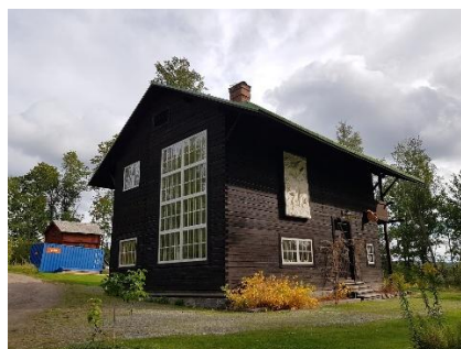
Rackstadmuseet i Arvika

PRIS: 3 790 kr (Enkelrumstillägg: 475 kr)