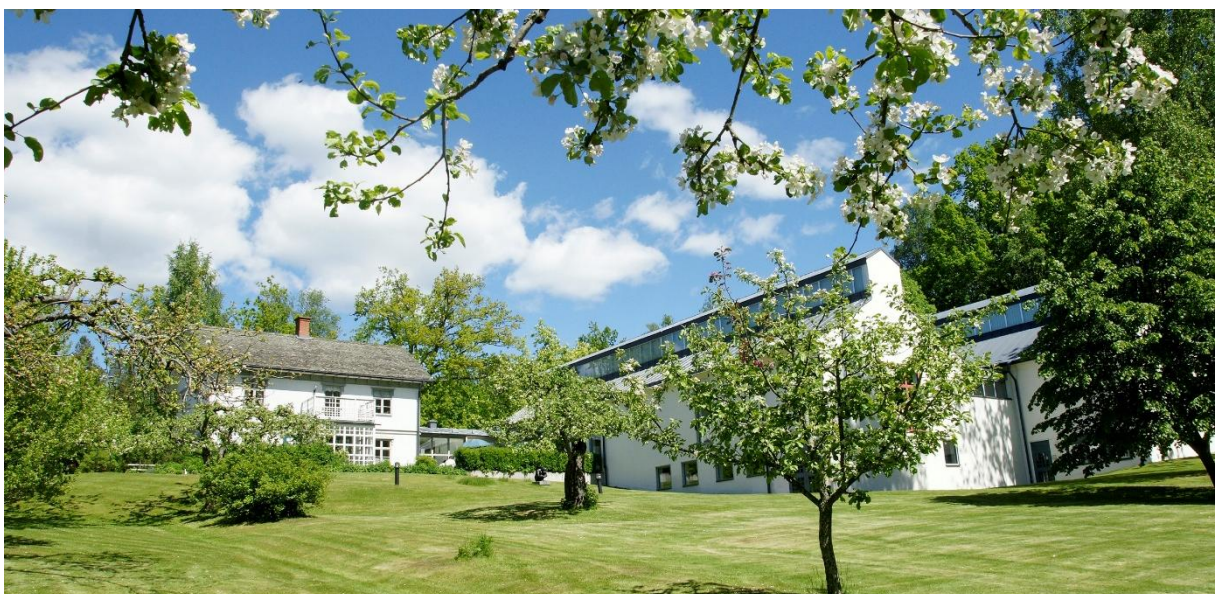
Rackstadmuseet Arvika

Frukost på vårt hotell. Vi åker nu till Arvika där vi besöker det naturskönt belägna Rackstadmuseet som öppnades 1993 bredvid konstnären Christian Erikssons bostad och ateljé Oppstuhage från slutet av 1800-talet. Här verkade på den tiden Rackstadkolonin som var en grupp kända och mindre kända konstnärer. Mycket av den konst som idag finns här har anknytning till dessa herrar, men här visas även temporära nutida utställningar. Vi blir guidade runt av en lokal guide och får därefter tid på egen hand både i museet och i deras vackra trädgård, samt även besöka deras trevliga café. Innan vi lämnar Arvika serveras dagens lunch och vid 14-tiden påbörjar vi vår hemresa. Med en bensträckare på Rasta i Brålanda beräknar vi vara tillbaka vid Lilla Varholmen runt kl. 19.30 och i Frölunda någon halvtimme senare.