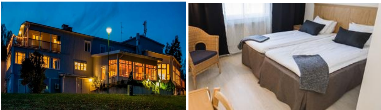
Vårt hotell Frykenstrand