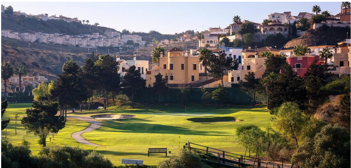
La Marquesa Golf