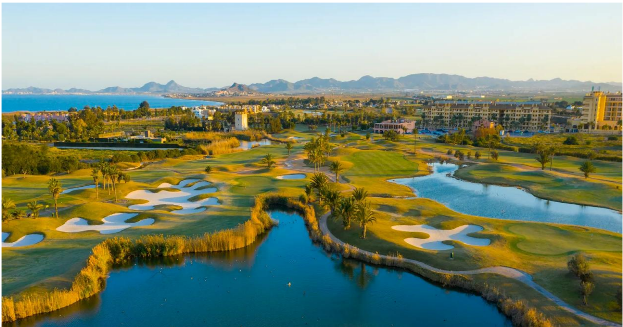
Serena Golf

Välkommen till vårt nya golfresmål fyra mil söder om Alicante! Följ med oss till den del av Spanien som har det mildaste och torraste klimat av alla områden i Spanien. Här spelar man golf året om, och det är fortfarande sommarlika temperaturer i november! Vi bor vid havet på fina Hotel Meridional i Guardamar de Segura, mitt mellan Alicante och Torreveija. Under tre dagar spelar vi golf på La Marquesas fina golfbana och de två andra dagarna spelar vi på La Serenas fina golfbana.