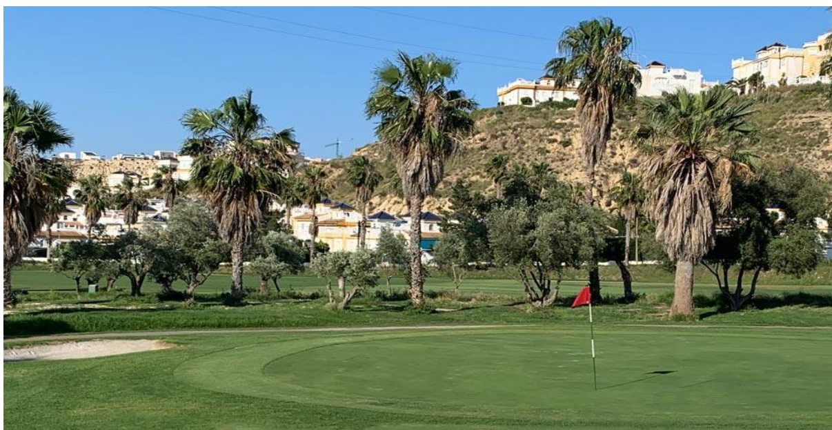
La Marquesa Golf